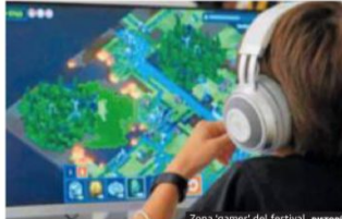
Zona 'gamer' del festival. DISTOPÍA

Los videojuegos adquieren protagonismo con los 'Distopía Games' el viernes de 17 a 21.30 ho-