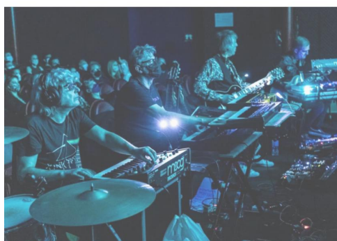
La banda murciana Los Amigos de los Animales. Los Amigos de los Animales

La segunda edición del festival Distopía vuelve a apostar por la ecología, películas, juegos y conciertos