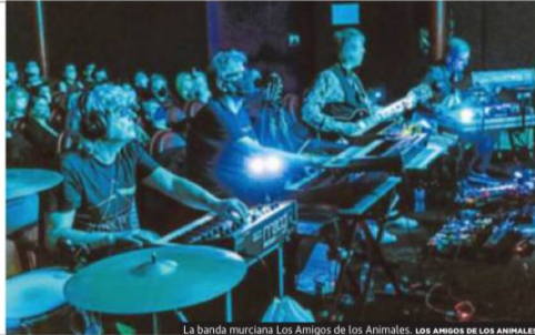
La banda murciana Los Amigos de los Animales. LOS AMIGOS DE LOS ANIMALES

La segunda edición del festival Distopía vuelve a apostar por la ecología, películas, juegos y conciertos